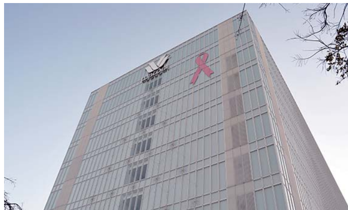
▲株式会社ワコール本社

女性の「美しくありたい」という願いに寄り添い、主力事業であるインナーファッションからライフスタイルの視点まで含めたボディデザインビジネスを展開するワコール。そんな同社のものづくりを、よりよい職場環境の構築という点で支えているのが総務部だ。IT機器をはじめ、数多くの備品を扱うなか、2015年には新しくカシオの水銀ゼロプロジェクターXJ-V1を導入。使う場所、時間、人を超えて広がりを見せるその活用法について話を聞いた。