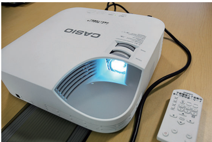
▲会議室に設置された XJ-V1

福島太陽誘電の新たなスタートを支えるべく、導入されたカシオの水銀ゼロプロジェクター。XJ-V1、XJ-M251、XJ-H1750 の 3 モデルが活躍する場合は、これからもますます広がりそうだ。