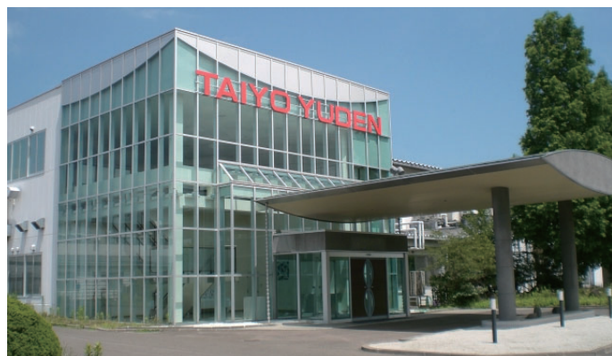
▲福島太陽誘電株式会社

福島太陽誘電株式会社は、電子部品の開発・製造・販売を行う太陽誘電グループの製造拠点のひとつ。情報通信やカーエレクトロニクスをはじめ、幅広い分野のデバイスに搭載される電子部品の製造を行っている。そんな同社の開発・設計業務を、IT環境という面でサポートしているのが、カシオの水銀ゼロプロジェクター。同社では、最新の XJ-V1を含め 3モデルを導入し、会議や打ち合わせなど、日々の業務に欠かせないアイテムとして活用しているという。